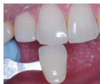
22 years later – total color stability over time Dentistry by: Bud Mopper, DDS, MS