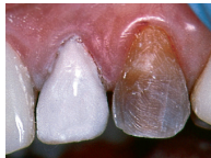
Application of Pink Opaque