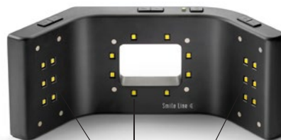
Tre grupper LED lys

Smile Lite MDP kan betraktes som et "mini foto studio". Enheten er utstyrt med tre grupper LED's (light emitting diodes). Hver gruppe kan lyse opp / brukes individuelt og du har også muligheten til å justere lyset ved hjelp av en dimmer (fire ulike trinn).