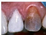
Application of Pink Opaque